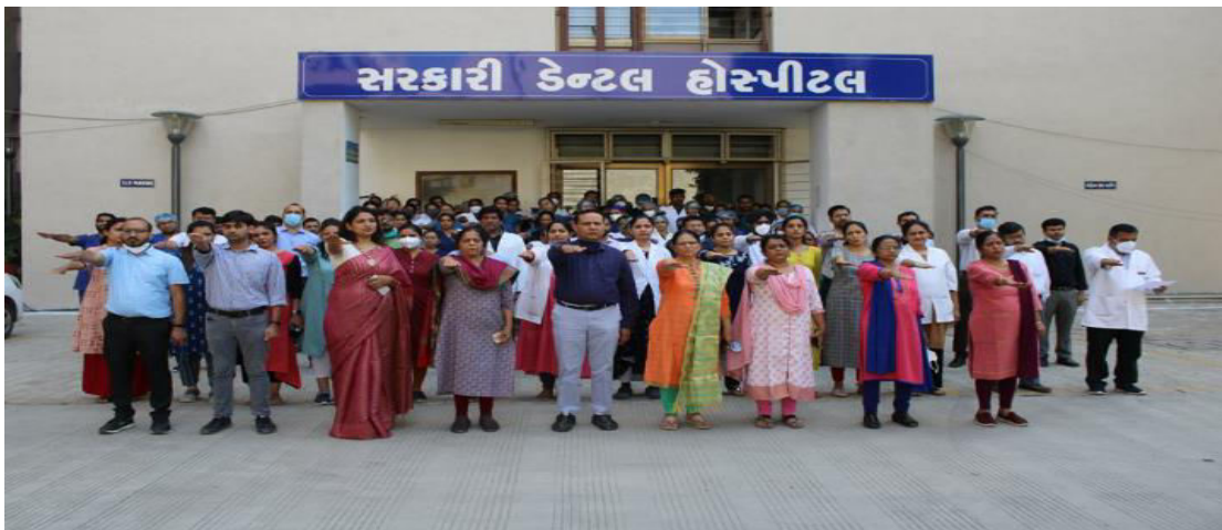
UNITY DAY- OATH TAKING CEREMONY