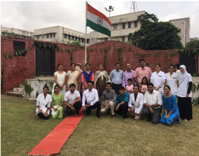
INDEPENDANCE DAY- FLAG HOISTING