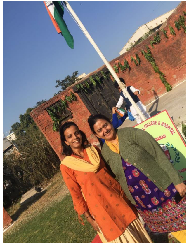
FLAG HOISTING ON REPUBLIC DAY