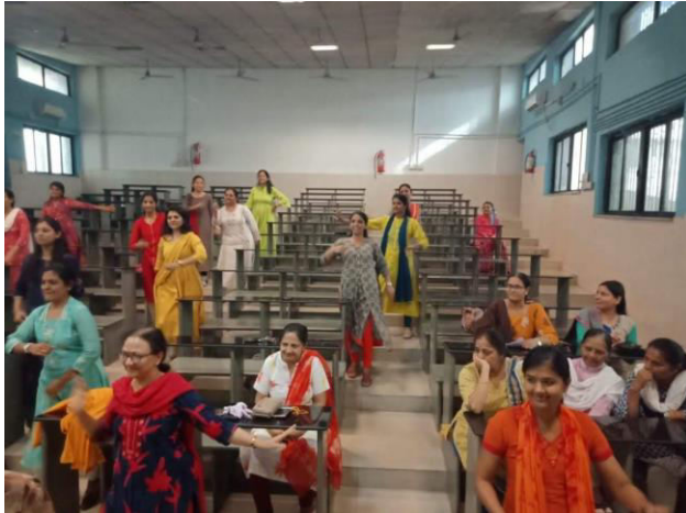
ZUMBA FITNESS PROGRAM ON INTERNATIONAL WOMEN 'S DAY