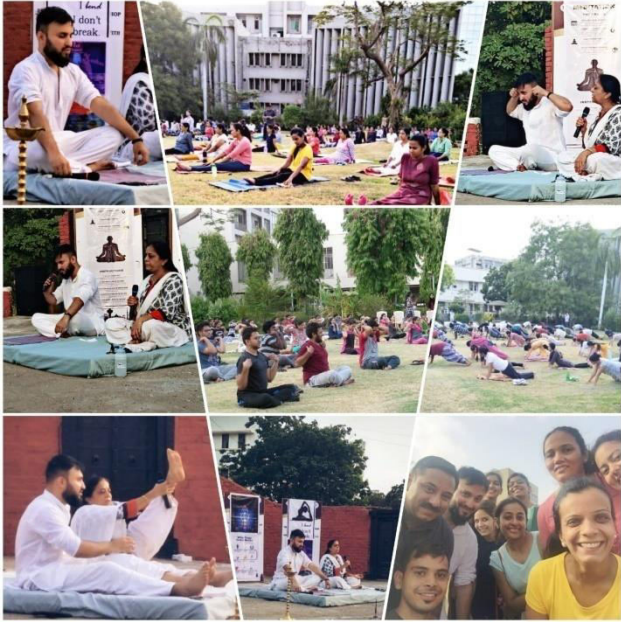
YOGA DAY CELEBRATION